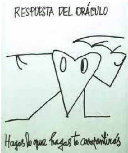
ARTEFACTO “RESPUESTA DEL ORÁCULO” – NICANOR PARRA